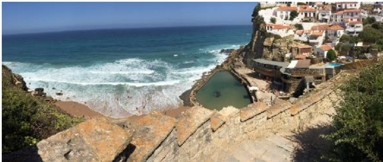
Les environs de Sintra