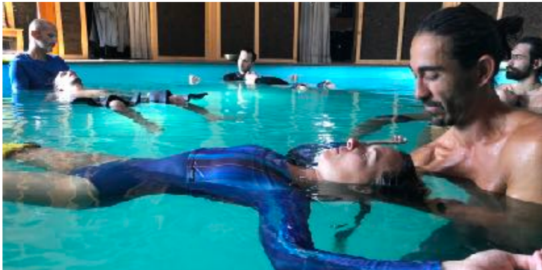
Ostéopathie aquatique intuitive 5D