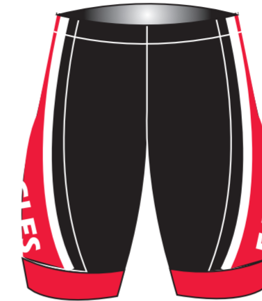
MENS SHORT CARBON CHAMOIS