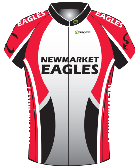
WOMENS JERSEY FULL ZIP