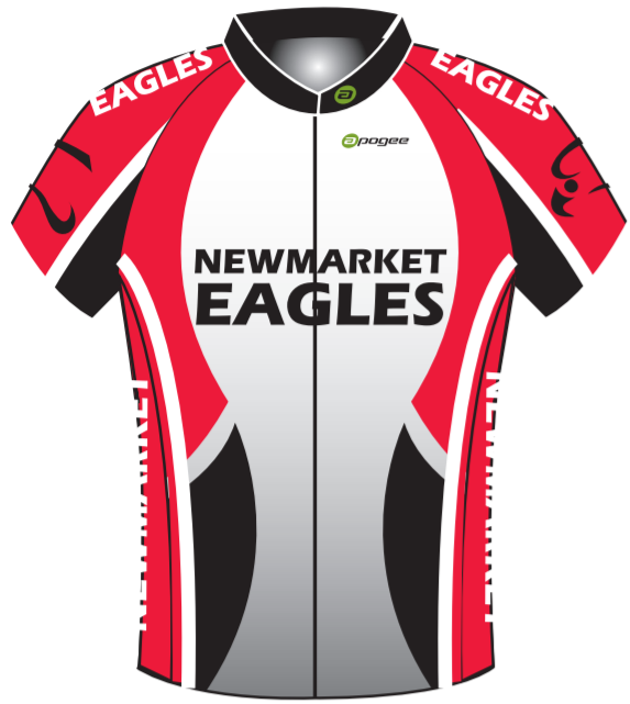
MENS JERSEY (REGULAR FIT) FULL ZIP