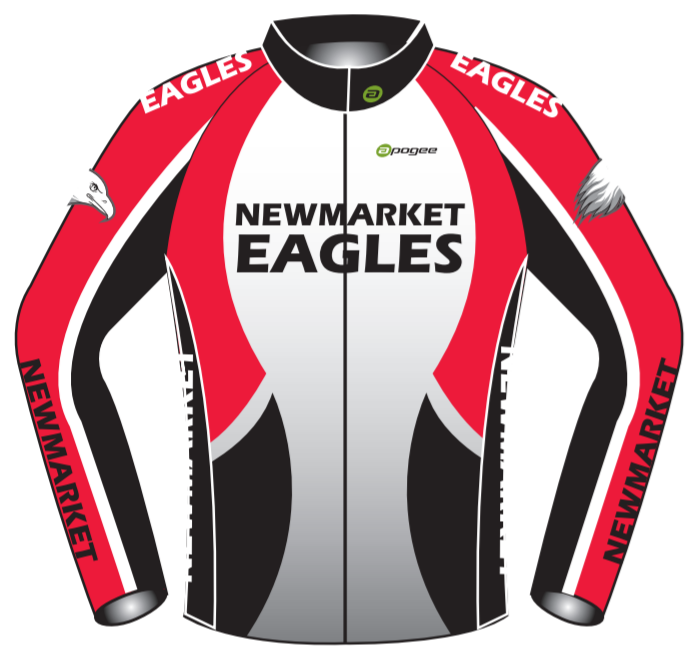
VELOCITY THERMAL JACKET