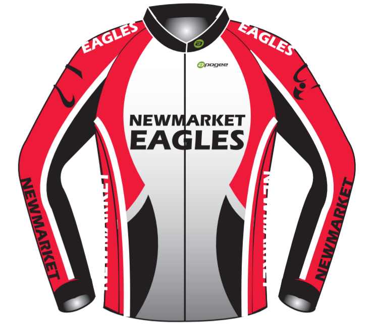
LONG SLEEVE JERSEY FULL-ZIP/BRUSHED LINING