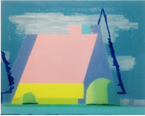
Albert Zwaan 'Bungalow bij avondlicht'

Galerie Nasty Alice Sint Antoniusstraat 10 5616 RT Eindhoven 040-2435834 info@galerienastyalice.nl