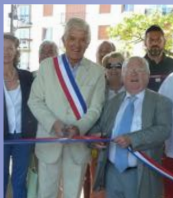
Avec Serge Caseris Maire du Mesnil-le Roi