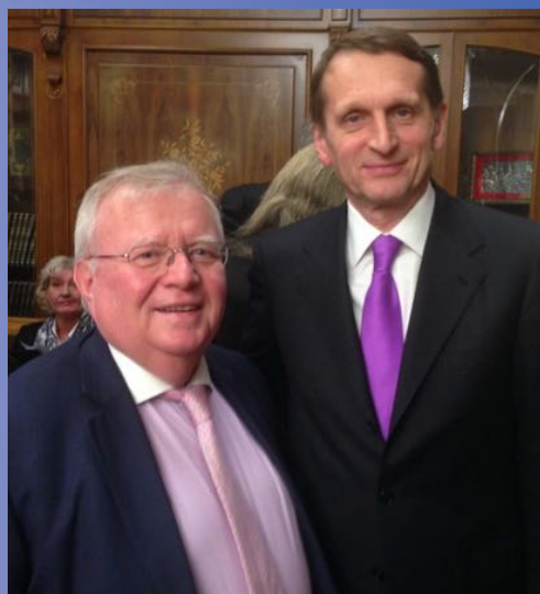
Jacques Myard à Moscou avec Serguev Narychkine, Président de la Douma, le 10 avril 2015