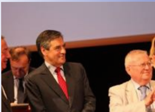
Avec François Fillon, ancien Premier ministre