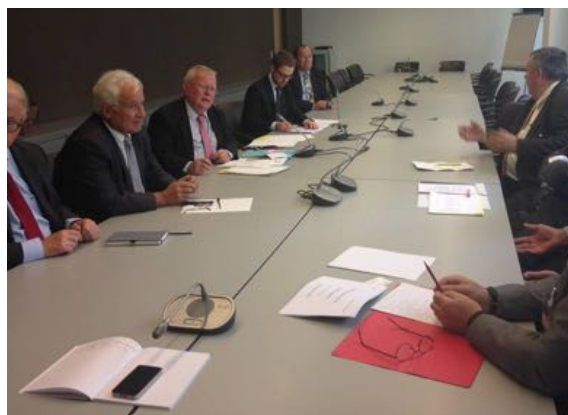
Jacques Myard président du groupe cheval à l'Assemblée nationale reçoit le 9 juin 2015 les représentants des sociétés de courses inquiets sur le devenir de la filière hippique

Le contexte général est marqué par la hausse de la TVA portée de 5,5% à 20%, la concurrence des paris sportifs, la chute des paris hippiques. Les enjeux PMU ont baissé de 8% depuis 2013, les sociétés mères, France Galop et le Trot, ont un déficit cumulé de plus 80 Millions d'euros. Fort de l'appui des 70 députés membres du groupe cheval qu'il préside, et à l'écoute des acteurs de la filière, Jacques Myard se mobilise pour alerter les autorités sur le nécessaire redressement de la filière. Il a demandé au commissaire européen chargé de la fiscalité, P. Moscovici, de négocier à Bruxelles la baisse de la TVA pour le secteur équin ; alors que le Gouvernement exige un retour à l'équilibre des comptes des sociétés-mères, Jacques Myard a fait part de sa préoccupation sur les investissements pharaoniques de Longchamp et la gouvernance de la filière. Les conséquences d'une telle situation sont graves : le creusement à terme des déficits, une baisse drastique des allocations et des aides aux hippodromes, la fermeture envisagée d'un hippodrome parisien, des faillites en série.