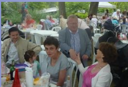
A la fête de la Marguerite au Vésinet