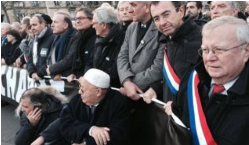
Manifestaion du 11 janvier 2015 avec le Sénateur Bruno Retailleau