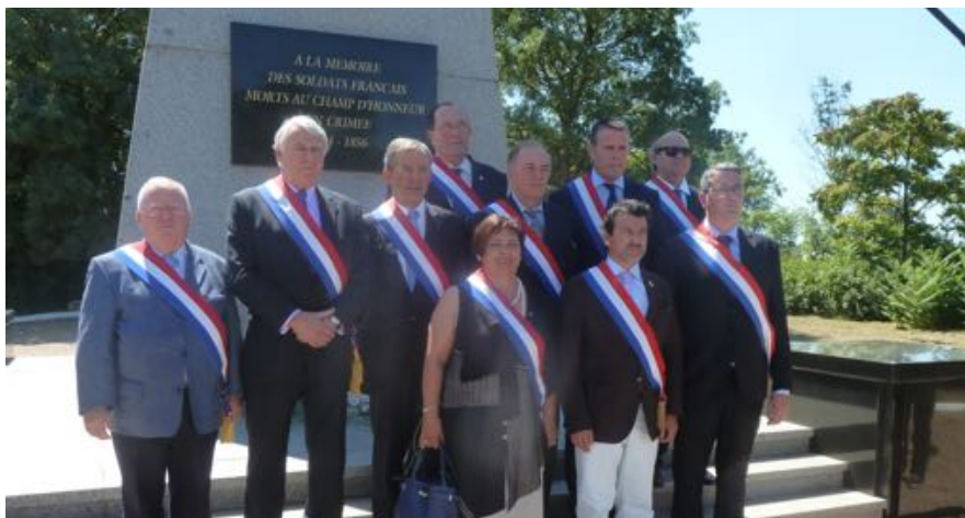
Avec ses collègues, Jacques Myard rend hommage le 24 juillet 2015 au monument aux morts des soldats français morts au champ d'honneur en Crimée en 1854-1855.

Il est urgent que la politique étrangère française retrouve son indépendance et sa cohérence.