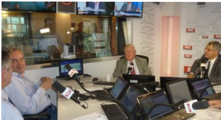
Dans l'émission d'Olivier Truchot sur RMC

La lutte contre le terrorisme islamique est désormais une ardente obligation.