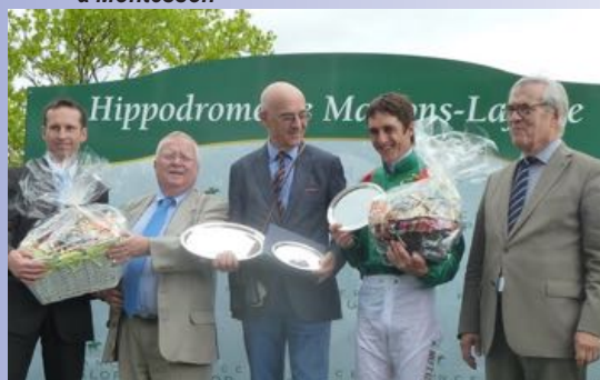
Lors de la remise de prix à l'hippodrome de Maisons-Laffitte