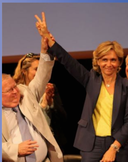
avec Valérie Pécresse, Députée, Conseillère régionale