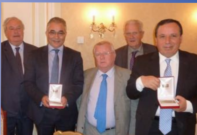
A Tunis chez le conseiller spécial du Président de la République