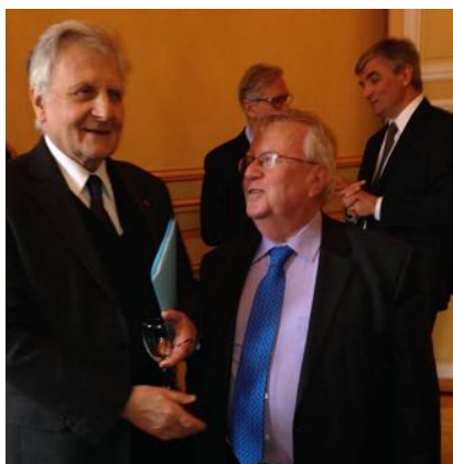
Avec Jean-Claude Trichet, ancien président de la BCE

Le principe de subsidiarité est bafoué, les démocraties nationales sont en péril. Pourtant, nous avons besoin de coopération européenne.