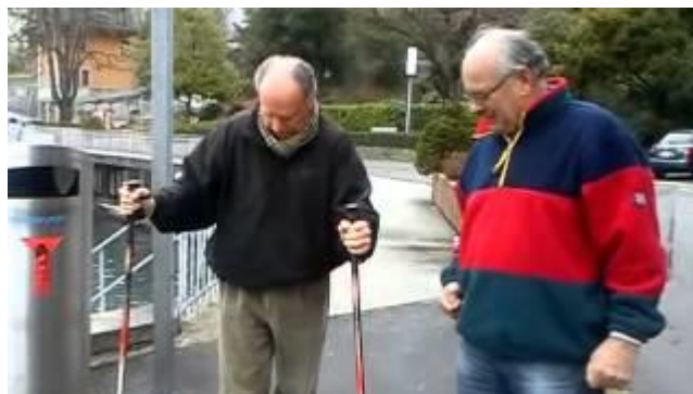
Et enfin les premiers pas !