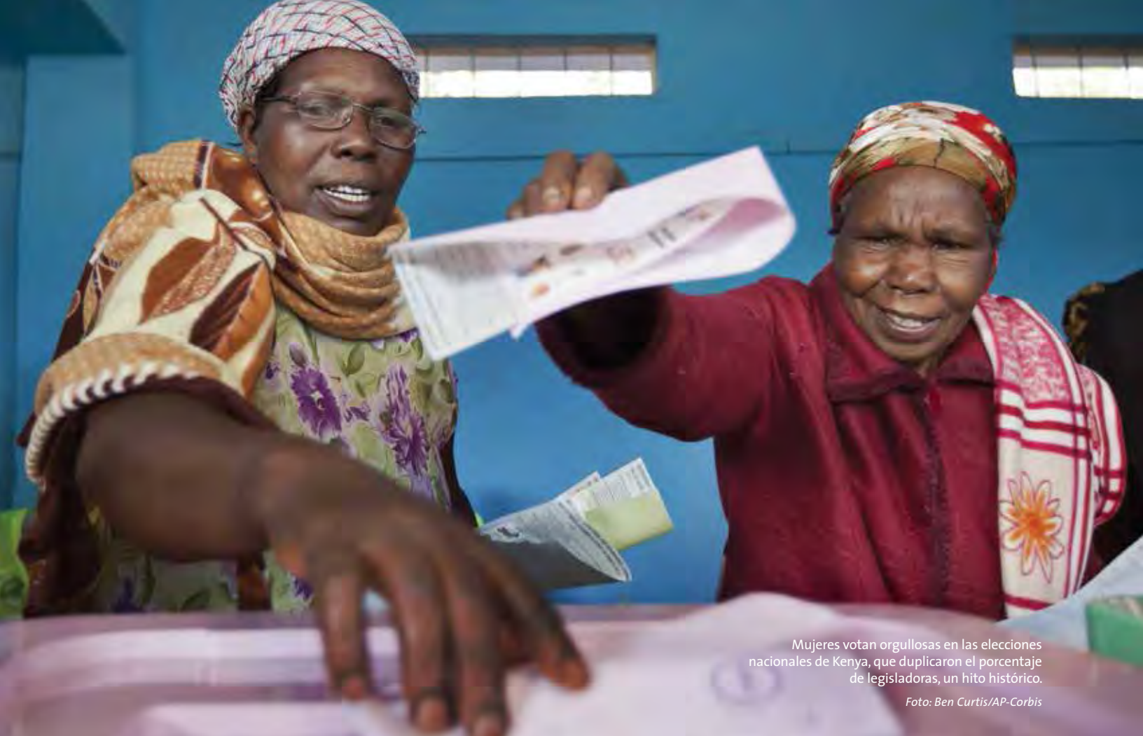
Mujeres votan orgullosas en las elecciones nacionales de Kenia, que duplicaron el porcentaje de legisladoras, un hito histórico.