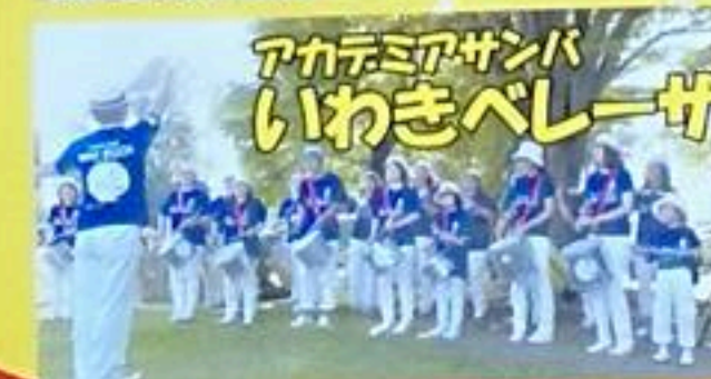
アカデミアサンバ いわきベレーザ

「ラテン音楽」の催しではありません。 「ラテンな福島県人」の楽しい場です。 福島県には、今も昔もラテンな人たちがいっぱい。昨年10月、そんなたくさんの仲間をわっと横浜に集めて、盛大に音楽祭を開催しました。明るく前向きな福島県人の元気な姿を首都圏の多くの方々に楽しんでいただきました。 その後、福島でも見てみたいぞ!という要望を県内在住の方からたくさんいただきました。そのリクエストにお応えして、今回の音楽祭を開催します。 福島県ではなかなか触れることの少ないラテンな雰囲気。こんなにたくさん楽しい人たちがいる!という事実を知っていただき、今後も応援を続けていただけたらうれしいことです。お楽しみください。