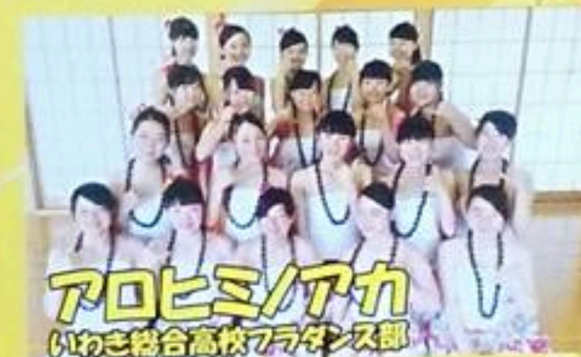
アロヒミ/アカ いわき総合高校フラダンス部