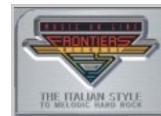
Frontiers Records - Naples - Italy