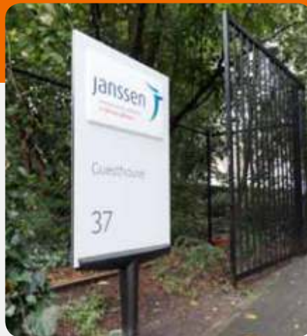
Macer Exterior identificativo con luz incorporada