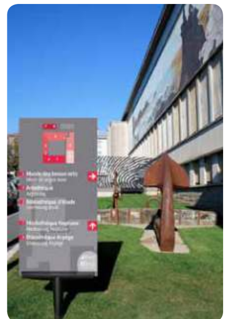
Panel de situación