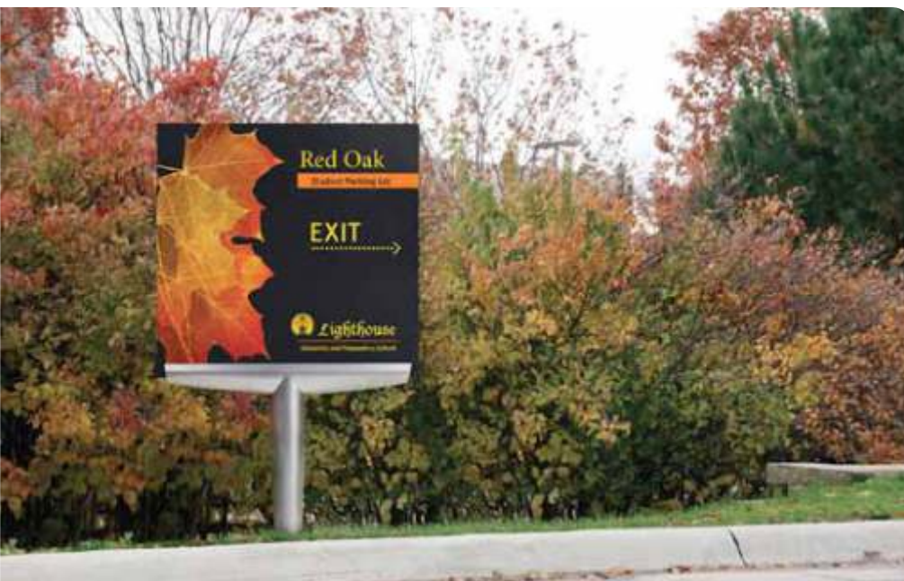
Señal identificativa combinada con información direccional

Macer Exterior no sólo permite crear señales de cualquier forma y contenido gráfico, está desarrollado para soportar incluso las condiciones climatológicas más extremas, y mediante la combinación de Macer Exterior con Macer Interior puedes conseguir la coherencia entre tus soluciones de señalética exterior e interior.