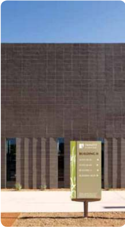
Señal identificativa combinada con información direccional