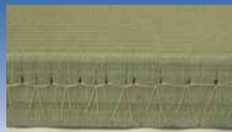
●千鳥縫い、直線縫い