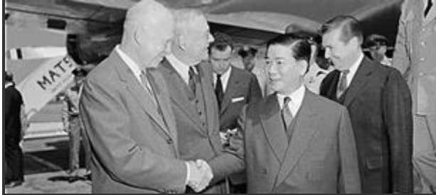
Tổng thống Ngô Đình Diệm trong chuyến công du Hoa Kỳ năm 1957