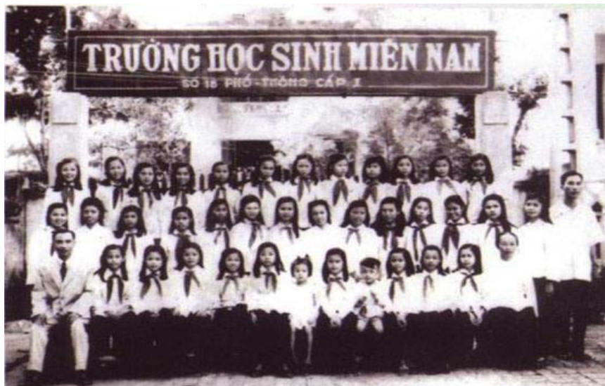
Tập thể thầy và trò lớp 2 trường số 18 (năm 1956)

Số phận những người "tập kết" rất gian nan. Hầu hết bị tống đi các nông trường quốc doanh; nông trường quân đội (nếu người tập kết là quân nhân); đi làm "công nhân" trồng rừng ở các lâm trường quốc doanh thuộc các vùng hoang hoá. Những trẻ vị thành niên thì biên chế vào các "nhà tù kiểu mới" gọi là " Trường Miền Nam ", sống khổ sở, đói rét, thiếu tình cảm gia đình, bị kỷ luật khắt khe và còn phải lao động cực nhọc nên rất nhiều trẻ trốn ra ngoài, trộm cắp, làm điếm, bị tù đày hoặc cải tạo ở các trại nhi đồng (cũng là một thứ tù khổ sai).