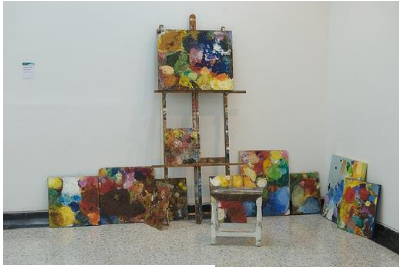
Lo que quedó del día, 2012

Entre las obras que buscan evidenciar procesos quisiera incluir un ejercicio del artista Fernando Cárdenas Cardozo , quien realiza obras regularmente figurativas de paisajes y figura humana, pero que en este caso recrea el pequeño paisaje desde el taller, evidenciando el proceso creativo sin importar el resultado, y siendo un artista tradicional en este trabajo se permite libertades desde el concepto.