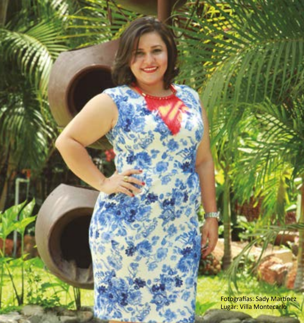
Lugar: Villa Montecarlo