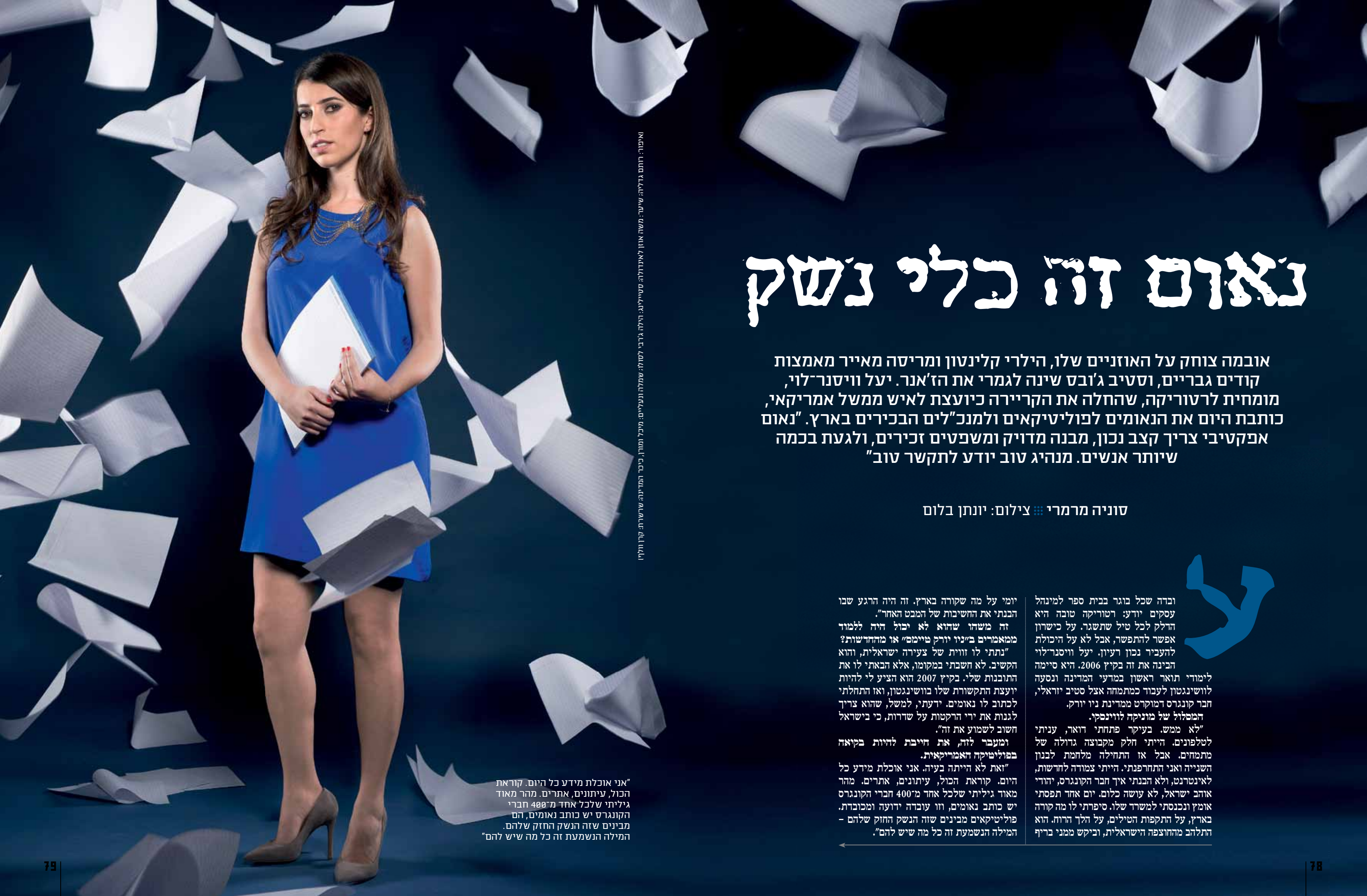
איפור: רותם גדליה; שיער: משה און לאנדולה; סטיילינג: הילה גרבי לטולה שמלה ונעליים; מיכל ומרו, כיכר המדינה, שרשרת קור וולן