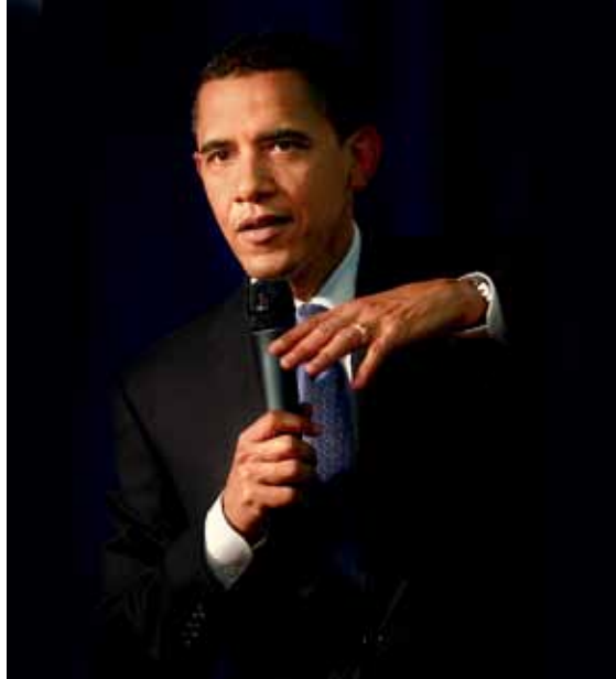
▲ "מדוע מאוד לזווית האישית, לסינקים הדיבור הגברי. הולכות על אופן חשיבה גברי, ומסרים גבריים." מריסה מאייר

5 פסחות ◀ אנשים שומעים את הנאום, ולא קוראים אותו. הסחות הדעת רבות וקל מאוד לאבד את הקהל. אסור להשתמש במילים מסובכות או במילים שהנאום יתקשה לבטא. משפטים קצרים יעזרו להבין מיד את המסר. כשהילרי קלינטון הודיעה שהיא רצה לנשיאות ב-2007, היא דיברה בגובה העיניים, במשפטים קצרים וכלליים: "So let's talk. Let's chat. Let's start a dialogue about your ideas and mine".