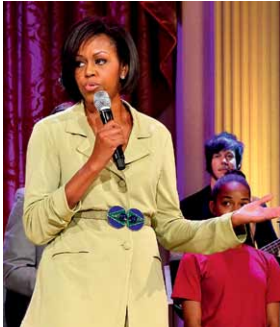
▲ "האישי תמיד מוכר. היא לא מדברת מנתחים כל מהלך שלו. אין ספק, שהיא הראשון מסוגו." סטיב ג'ובס