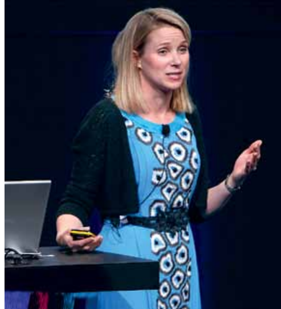
▲ "זה עולם גברי. נשים מאמצות את דפוס הדיבור הגברי. הולכות על אופן חשיבה גברי, ומסרים גבריים." מריסה מאייר