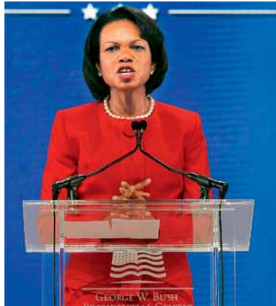
▼ "אף אחד לא זוכר מה אמרה, אבל כולם זוכרים שהיא הייתה רווקה, או מה עומק המחשוף שלה." קונדוליסה רייס