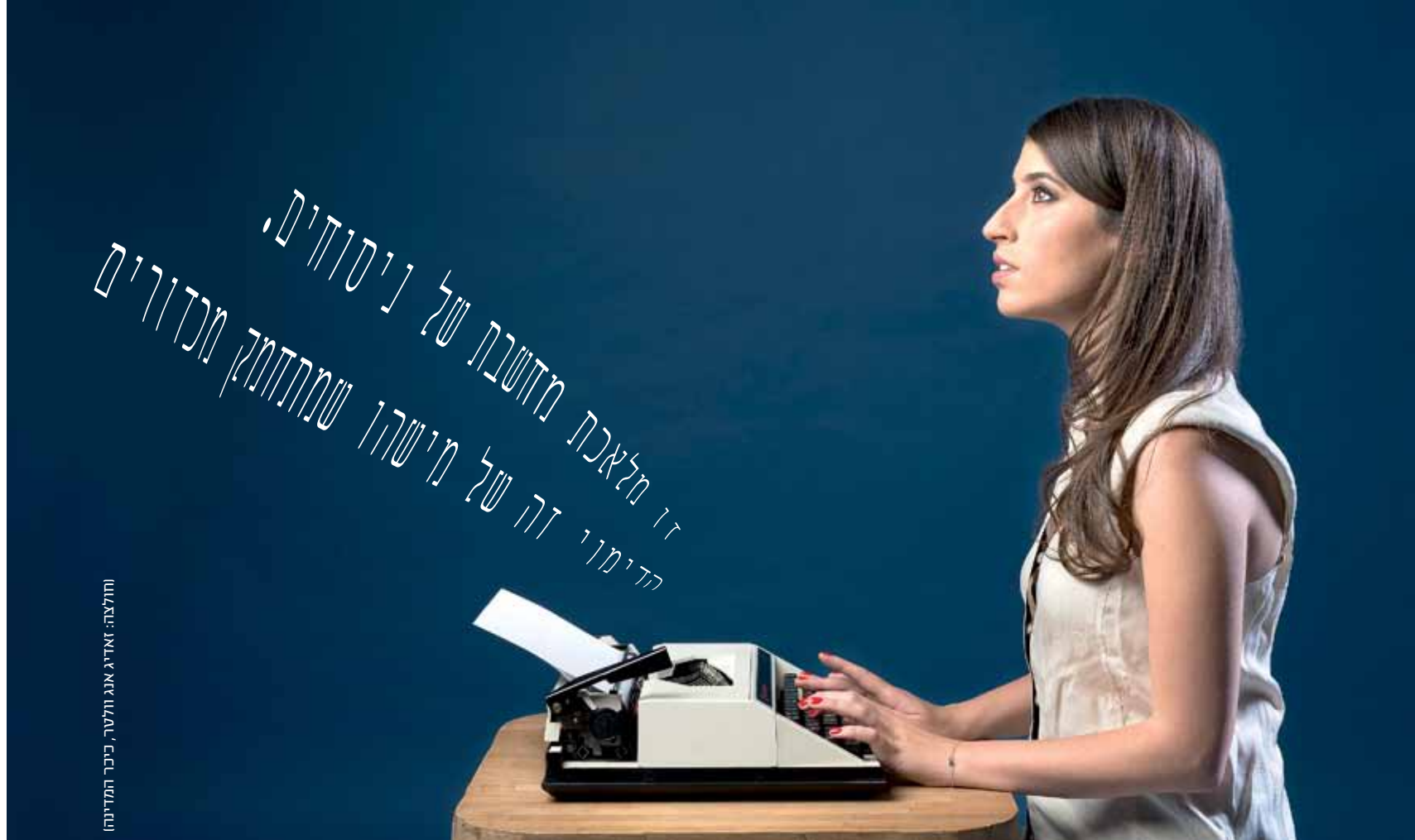
תולצה: זאדיג אנג ולטר, כיכר המדינה

“כתיבת נאום זו אמנות ותשוקה, ויש אנשים שיש להם אותה באופן טבעי. יש מבנה קבוע שכולל ציטוטים ואנקדוטות. חזרה תמיד עובדת טוב. חייבים להיות מודעים לסיניקים, לדעת אילו משפטים התקשורת תצטט. האישי תמיד מוכר”