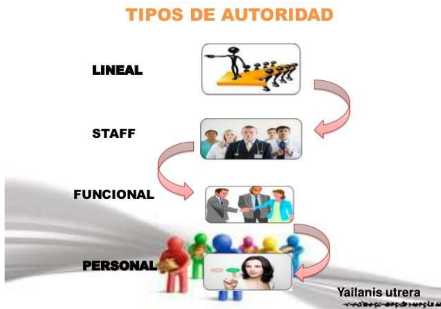
Esquema de los tipos de autoridad y organización según Yailanis Utrera. Yailanis Utrera.

No obstante, la existencia de autoridad en un grupo, siempre y cuando esta sea demostrable y no supuesta, no interfiere en la perspectiva anarquista del estudio de ese grupo.