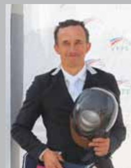
Cavalier français de saut d'obstacles

Le concours est d'ailleurs intéressant pour beaucoup de cavaliers car il y a de très belles épreuves dont quatre comptent pour la ranking list mondiale ! Chaque édition du Jumping réserve de grands moments de sport et je trouve que ce concours a toutes les qualités nécessaires pour franchir un jour le cap du CSI****. J'adore venir à Megève et ne louperais ce concours sous aucun prétexte ! C'est vraiment un événement en devenir. »