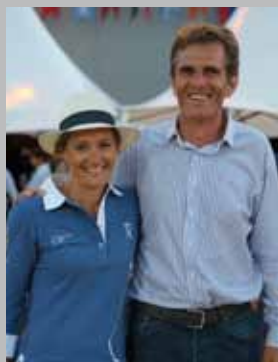
Président & Vice-Présidente du Jumping

« Une fabuleuse histoire qui continue de s'écrire ! Cette sympathique soirée où nous évoquions pour la première fois l'idée d'organiser à Megève un Jumping international semble dater d'hier... Pourtant, les années ont passé. Et ce projet aussi fou qu'il n'était passionné a pris corps, très vite, porté par l'enthousiasme d'un village, de partenaires investis et d'une organisation motivée.