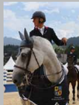
Cavalier français de saut d'obstacles