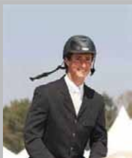
Cavalier français de saut d'obstacles

« Le Jumping International de Megève - Edmond de Rothschild est vraiment un concours particulier. Un très grand nombre de nations, parmi les meilleures mondiales, y est représenté et je suis toujours surpris de voir que des cavaliers viennent parfois de très loin pour pouvoir y participer. Cela s'explique notamment par l'accueil de « premier choix » que nous réserve l'organisation et l'ambiance, toujours très conviviale, qui règne sur le concours ! Je sais que l'événement a vraiment très bonne presse à l'étranger et d'ailleurs, dès que je vais au Portugal ou en Angleterre, j'entends des cavaliers en parler, ce qui prouve l'engouement des autres pays pour cette compétition.