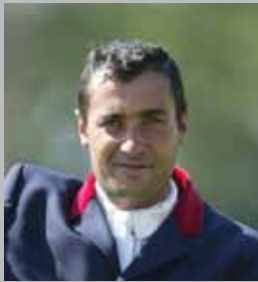
Cavalier français de saut d'obstacles

« L'ambiance, au Jumping International de Megève - Edmond de Rothschild, est particulièrement agréable et le fait de concourir en montagne, avec un tel panorama, est extrêmement plaisant. On ressent facilement, dans l'atmosphère du concours, que toute la ville se réunit et se mobilise autour de cet événement. Le public est très présent et curieux. Les chevaux, habitués aux indoor, ne sont pas surpris par la piste et s'adaptent très rapidement. C'est un concours que j'adore et que je recommande ! »