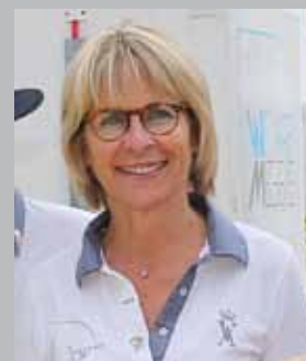
Maire de Megève