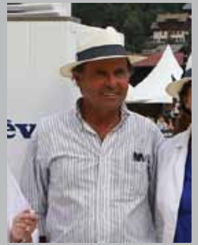
Chef de piste du Jumping