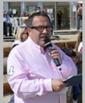
Speaker du Jumping