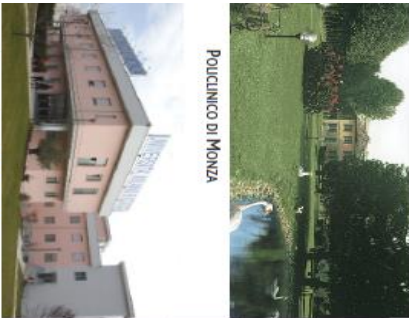
Istituto Clinico Universitario di Verano Brianza

Chiunque intenda svolgere un'attività sportiva deve sottoporsi ad un controllo medico che stabilisca l'idoneità fisica a svolgere tale attività. Considerata l'importanza di tale specialità il Policlinico di Monza ha voluto applicare un listino caratterizzato da tariffe ridotte per tutte le prestazioni che afferiscono alla medicina dello sport per le società sportive convenzionate.