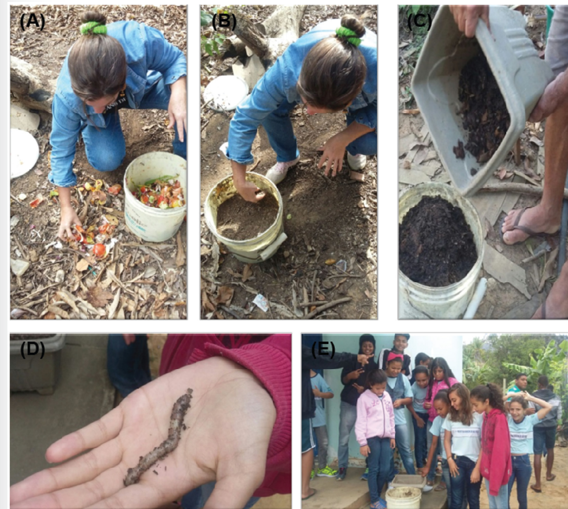
Figura 03: Composteira montada em balde plástico doado pela comunidade recebendo camadas de matéria orgânica oriunda da cozinha da escola (A), substrato (B e C), e minhocas (D), doadas pelos próprios alunos (E).

O público alvo formado pelos alunos mos-