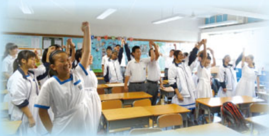
學生積極參與互動環節

2015年9月14日，本組與健康教育組合作，於中一級「多元學習堂」進行性教育工作坊，以班本形式進行，目的是讓中一同學認識兩性相處之道。期間同學反應熱烈，積極投入討論。