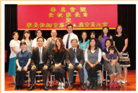
新任家長教師會(第十八屆)常務委員會全體委員與黎校長合照