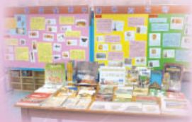
「窺探美索不達米亞文明」展覽

圖書館與歷史科合作，於2015年10月5日至23日期間，籌辦了「窺探美索不達米亞文明」展覽，讓同學透過展板增加對美索不達米亞文明（包括：蘇美爾、亞述及巴比倫）的知識。另外，於展覽期間，圖書館將同時展出多本介紹古文明的圖書，讓同學從中窺探古文明的國度，了解古代人的生活與智慧。