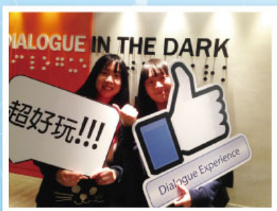
七十五分鐘的黑暗體驗令大家明白視障人士的生活困難，很棒！

為鼓勵同學參與義工服務，關心社群，本組積極計劃多元化的義工活動，讓有興趣的同學獲得豐富的服務經驗。於 2015 年 12 月 30 日，我們與香港青年協會「建生青年空間」的導師一起參與「黑暗中的對話 DIALOGUE IN THE DARK」。在全黑的真實場景裡，同學們完全喪失了平日眼睛的功能，在惶恐的情況下，大家僅能以其他感官去感受這個陌生的環境。過程中他們深刻地體會到身體殘障所帶來的生活困難，亦同時敬佩殘疾人士所具備的勇氣和堅毅精神。這次是難忘和寶貴的體驗，相信對將來的義工服務有著很大的幫助。