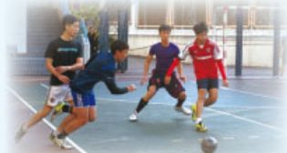
第五屆師生足球比賽情況

第五屆師生足球比賽已於2015年11月28日舉行，共有八隊師生出賽，過百學生到場打氣，比賽氣氛良好。