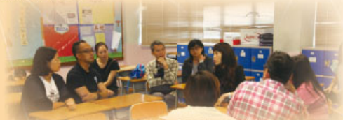
中一班主任與家長交談甚歡