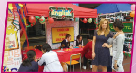
English — TTC Information Day

7. The English Department was involved in the establishment of a station in TTC Information Day 2015. A game stall was set up and videos were shown to introduce the English teaching and learning at the school.