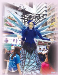
沿途氣氛熱鬧，市民樂此不疲！