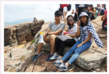
同學在粉砂岩形成的地貌前合照