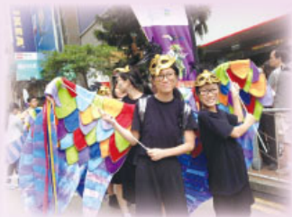
同學們無懼風雨，合力撐起作品，由記利佐治街出發，巡遊到駱克道去。