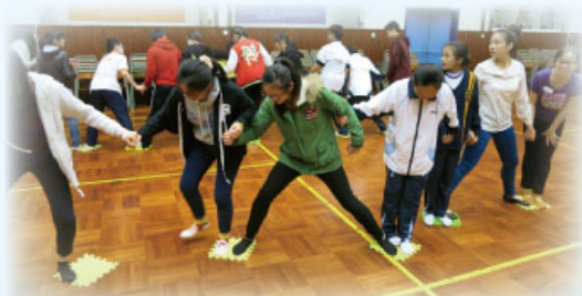
朋輩輔導員積極參與活動

2015年9月14日，本組邀請「學友社潛能發展中心」到校舉辦「歷奇活動」，內容豐富，上午活動只有朋輩輔導員參加，目的是提高朋輩輔導員的自信心及團隊精神。下午活動則是朋輩輔導員及中一同學一同參與，目的是建立彼此互相合作精神。