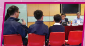
本校同學向大學教授發問

本校三位參加「2016 香港學生科學比賽」的中二學生，於2016年1月7日到香港科學館出席顧問分享會，並向兩位大學教授介紹了他們的研習題目及研究方向，而兩位大學教授亦給予他們寶貴的意見。