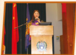
家長候選人宣讀參選政綱