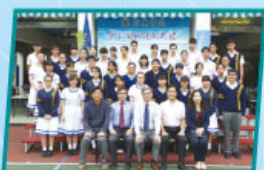
新任學生領袖與正、副校長及學生培育主任合照

本年度領袖生、朋輩輔導員、健康家族、學生會幹事、學會幹事及六社幹事的就職典禮在10月12日的早會舉行。新任學生領袖透過宣誓儀式，承諾肩負領導及服務全校同學的重任。