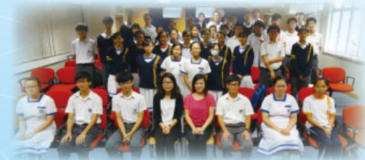
出席師生在學生議會簡報會後合照