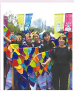
以莫扎特《魔笛》為創作藍本的撐杆木偶－「彩鳥」

本年度視覺藝術科參加了由渣打銀行和香港青年藝術協會合辦的「渣打藝趣嘉年華 Standard Chartered Arts in the Park」，當中超過 3,500 位本地藝術家及青少年以多個著名古典樂章為創作靈感，打造逾千件創意無限，超乎想像的藝術作品和歌舞表演。嘉年華會為期兩日，於銅鑼灣街頭及維多利亞公園舉行，活動包括：夜光巡遊、大型木偶巡遊、藝術攤位、非洲鼓樂、歌舞表演等等。而本校同學們則以莫扎特的《魔笛》為藍本，揉合民族藝術元素，製作出一件名為「彩鳥」的撐杆木偶服裝，加上誇張的頭飾，一行 18 人浩浩蕩蕩地到銅鑼灣街頭參加巡遊表演，沿途揮舞彩帶，配合大會的歌舞表演，令四周充滿歡欣氣氛，是一次難得的藝術經驗。