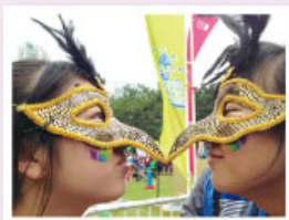
趁空檔，拍照自娛一下呢！