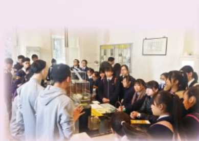
導師講解疫苗和舊細菌學 / 病理學檢驗所工作

2015 年 12 月 17 日，中五級修讀「健康管理與社會關懷科」的同學到「香港醫學博物館」參加「古往今來公共衛生、撲滅及預防傳染性疾病的發展」導賞活動，以認識過往華人聚居的太平山區的面貌，同時亦參觀「沙士」疫症 (SARS) 展覽、流感大流行及當前傳染病的威脅。