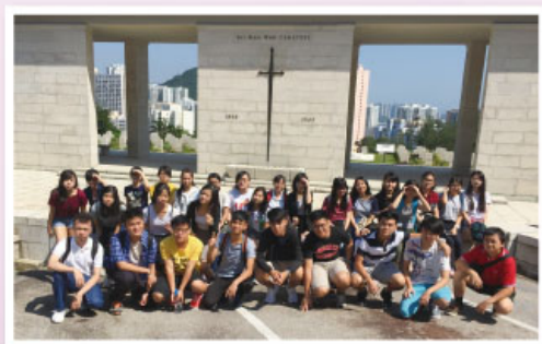
同學在西灣國殤墳場前合照

1. 中史科於2015年10月9日舉辦墳場歷史考察活動，本校老師先帶領中六級修讀中史與歷史科的學生參觀位於柴灣的西灣國殤墳場。2015年正是二次大戰結束70周年紀念，藉著是次參觀，讓學生更了解二戰時香港戰役的詳情，並緬懷一班為保衛香港而捐軀的士兵。