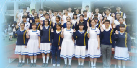
新任學生領袖宣誓就職