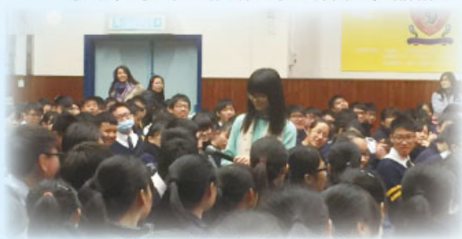
同學在互動教育講座中發表意見

此外，訓導組亦鼓勵同學以功抵過，繼續推行「自省更新」及「守時銷過」的計劃，協同學糾正錯誤行為，培養正向品格。