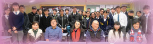
本校中六同學到協和中學參加聯校口試練習後，兩校學生及中文科老師留影。

12 月 18 日，本校中六同學與九龍區中華基督教會協和中學合辦了一次聯校口試練習，共有 15 名中六同學參加。另外，1 月 16 日，崇真會屬下中學也舉辦了一年一度的聯校模擬口試，參與學校包括沙田崇真中學、粉嶺救恩書院、基督教崇真中學、東華三院黃笏南中學及崇真書院。本校共有 20 位中六同學出席，他們能透過這些機會，與其他學校同學一起參與如同公開考試一般的口試訓練。同學不但有練習機會，更有互相觀摩及評鑑同學的機會，更難得的是能夠聽取不同學校老師的意見，以提升自己說話方面的應試能力。