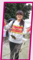
同學展示漁塘生態

中五修讀生物科的同學，於2015年11月28日參加了由「香港觀鳥會」主辦的探索漁塘生態活動，以了解香港的漁塘生態。