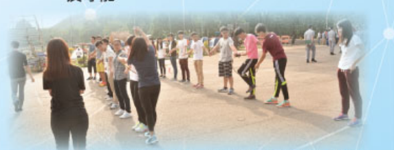
熱身活動——各組成員須一起鬥快完成穿越呼拉圈。

中一級學生於 12 月 18 日，到葵青劇院參與「折翼天使」話劇佈道會。學生從舞蹈家廖智身上體會人情的可貴及信仰對生命陶造的力量，部分同學因話劇的見証而深被感動。