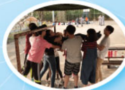
各組員須合力彼此協助穿越蜘蛛網，但不可接觸網線。