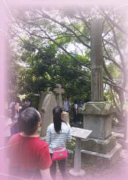
跑馬地天主教墳場內革命烈士楊衢雲墓

2. 中史科舉辦考察跑馬地天主教墳場活動，該墳場葬有不少香港歷史名人如革命烈士楊衢雲、華人領袖何啟及富商何東等，在參觀過程中同學親身站在歷史名人墓前，老師講解上述名人在中國及香港歷史上的重要性，令學生能生動及直接地理解歷史。