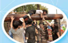
各領袖在同學的協助下完成攀越橫樑的任務。