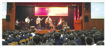
聖誕聯歡活動情況

本年度聖誕崇拜及聯歡活動已於2015年12月23日舉行，由學生會負責同學帶領抽獎及表演環節，表演嘉賓乃三名校友，獻唱環節還邀請高中同學即席上台與嘉賓合唱，活動氣氛良好，並能依時完成。