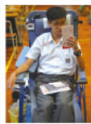
捐得是福、自得其樂

本校於 2015 年 9 月 30 日舉辦本學年「捐血日」。當天香港紅十字會流動捐血隊蒞臨本校，不少學校持分者響應捐血活動，共有 60 名本校師生參與。