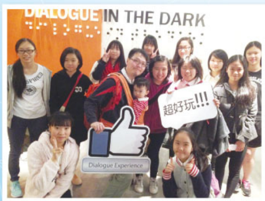
我們來到美孚參與「黑暗中的對話 DIALOGUE IN THE DARK」

本校今學年繼續舉辦「校本課後學習及支援計劃」活動，以加強本校同學對社會的認識及參與，擴闊他們在課堂以外的學習經驗，並增強他們對社會的認識和歸屬感。針對本校合資格學生的需要，推行多項課後活動，合資格參加的學生人數逾 264 名。