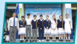
黎校長與新一屆學生會顧問成員合照