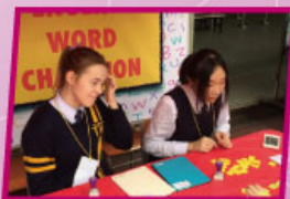
English — The Word Champion

All these activities and programs, in conjunction with the effective English Passport Scheme, have set the scene for more learning autonomy and self-directed learning among students, and the effects of these measures are expected to emerge in the second term.