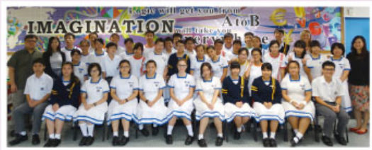
Our English Prefects

4. The English Prefects were inaugurated at the beginning of the school year and their responsibility was to plan, organize and implement all the English activities in the school. In the first term, these