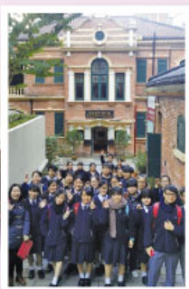
師生在法定古蹟－香港醫學博物館留影