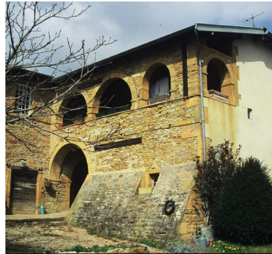
La maison du potier (1669-1686)

- Sous MOIRE , on prendra, à gauche la D 38 E puis on reviendra, droite-droite sur la route du bas vers La Morguière de Lenfert (4) qui causa la mort d'un homme le 24/02/1652 et la Maison du Potier .