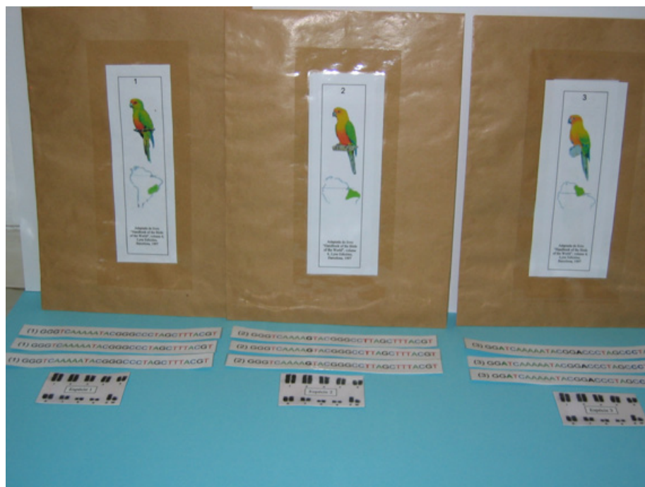
Figura 4. Foto ilustrativa dos três envelopes com os periquitos e a distribuição geográfica colados externamente no envelope, e os respectivos cariótipos e sequências do DNA que deverão ser colocadas dentro de cada envelope.