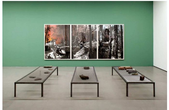
SEBASTIAN NEBE Die Höhle 2011/12 [Ausschnitt]