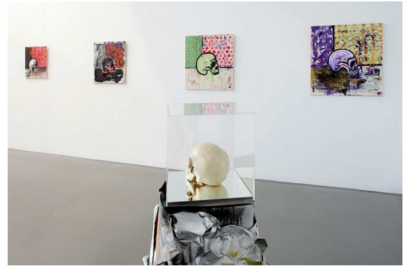
STEPHAN JÄSCHKE Skull / Schädel 2012 [Ausschnitt]