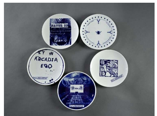
EDITION NATUR 3D

© die Künstler