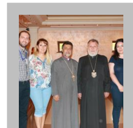
Jeunes de l'Eglise arménienne de France avec Sa Sainteté KAREKIN II

Du 1er au 5 juillet, plus de cent jeunes arméniens se sont réunis au Saint-Siège d'Etchmiadzine pour l'Assemblée annuelle de la jeunesse de l'Eglise Apostolique Arménienne. L'assemblée a commencé par l'enregistrement dans le bâtiment du séminaire Kevorkian, puis par la séance d'ouverture, pendant laquelle la jeunesse a confirmé son ordre du jour et a discuté des questions liées au règlement de leur organisation. Le 4 juillet, le groupe a été reçu par Sa Sainteté Karékine II, Patriarche suprême et Catholikos de tous les Arméniens. "tous les Arméniens qui passent à travers les arches de la sainte ville d'Etchmiadzine sont renforcés et transformés", Sa Sainteté a dit. "Je sais que vous aussi, vous avez senti une transformation pendant votre séjour ici, et je prie afin que vous continuiez à être inspiré, que vous retourniez dans votre diocèse et à renforcer votre travail d'organisation de jeunesse locales". Les quatre jours de l'Assemblée, étaient remplis de divers programmes de discussion. La jeunesse a également prévu une visite au diocèse de l'Eglise Arménienne d'Armavir. Cette réunion fructueuse a également été un précieux forum social pour les jeunes du monde entier et une opportunité de se rencontrer et de se mêler les uns avec les autres.