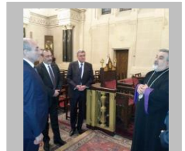
Le Premier Ministre d'Arménie, Mr. Hovik ABRAHAMIAN, a rendu visite au Primat du diocèse