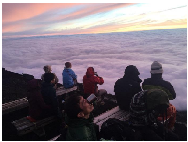
雲海の上から見るご来光は富士登山したものしか経験できない美しさ