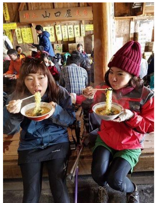
ラーメンを食べる新入社員達 辛くても最後まで頑張った後、仲間と食べるラーメンは忘れられない味

AM7:00時頃、ほぼ全員が登頂を果たし、山頂で記念撮影を行い、恒例のラーメンを食べ、至福の時間を味わいました。