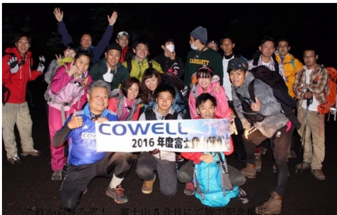
「これから登るぞ!」富士山5合目にて皆で記念撮影