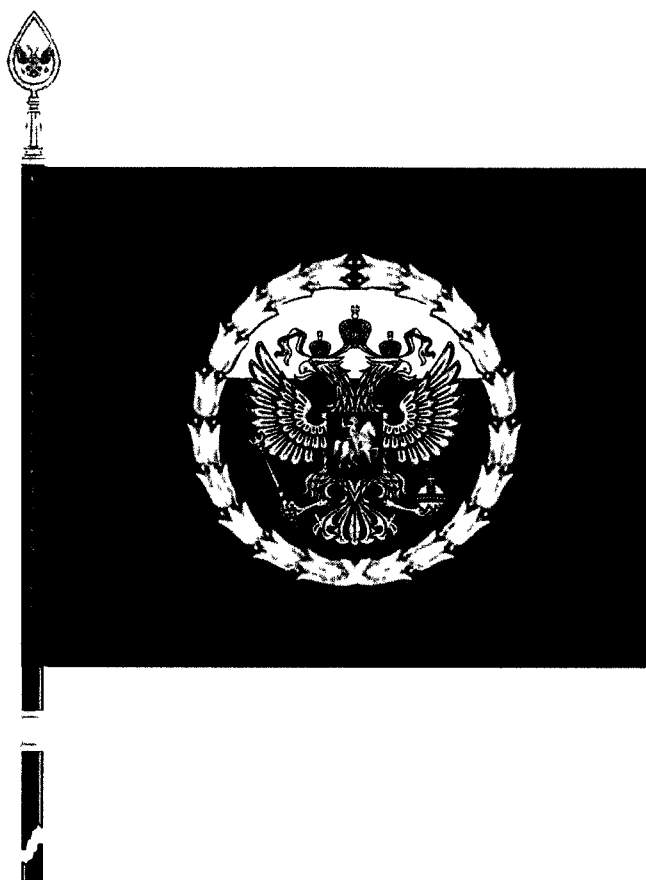
РИСУНОК переходящего знамени Президента Российской Федерации

УТВЕРЖДЕН Указом Президента Российской Федерации от 30 августа 2009 г. № 977