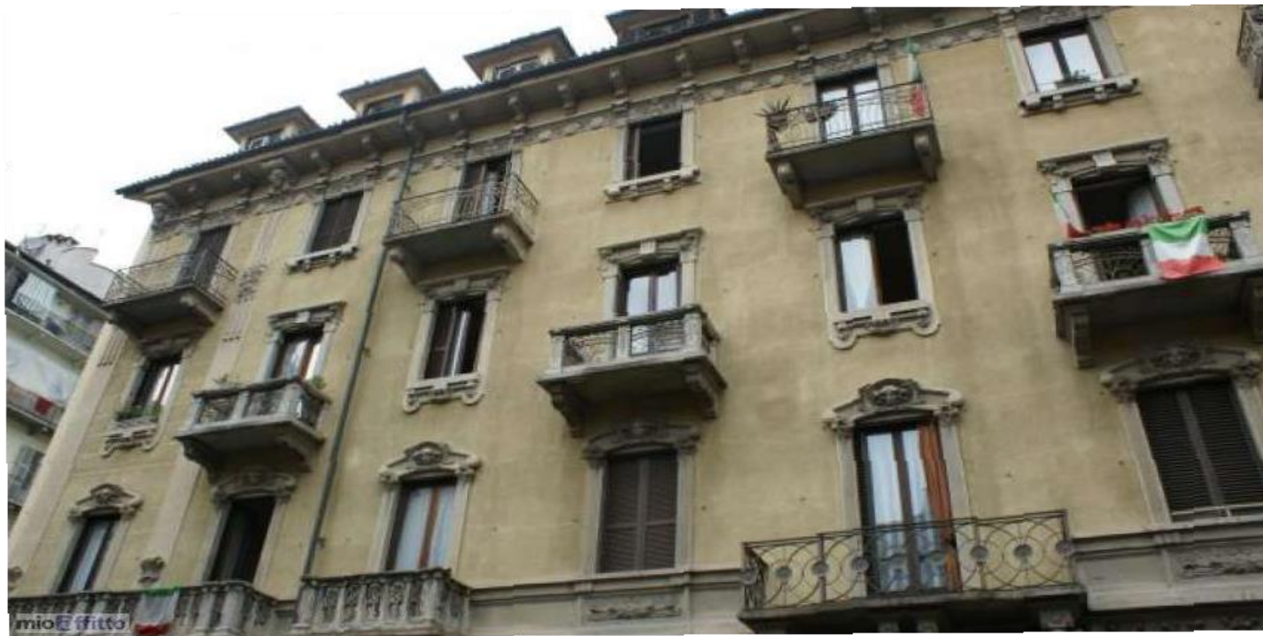
Rif. Sezione B: Vita civile in Italia