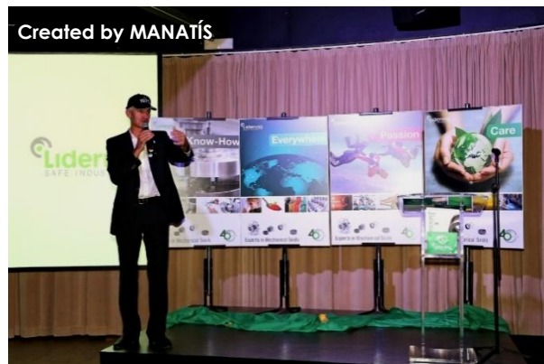
Imagen en la que podemos ver los cuatro conceptos que Manatís creó para el evento.

Manatís ayudó a crear un ambiente dinámico e ingenioso para generar orgullo de pertenecer a la entidad que representa a todos sus participantes. En la velada no solo adecuó el espacio y supervisó todos los detalles como catering, iluminación, sonido, decoración, ritmo del acto... sino que se consiguió reforzar con un juego los valores de la empresa para sus estrategias comerciales, mejorando así las relaciones interpersonales y el