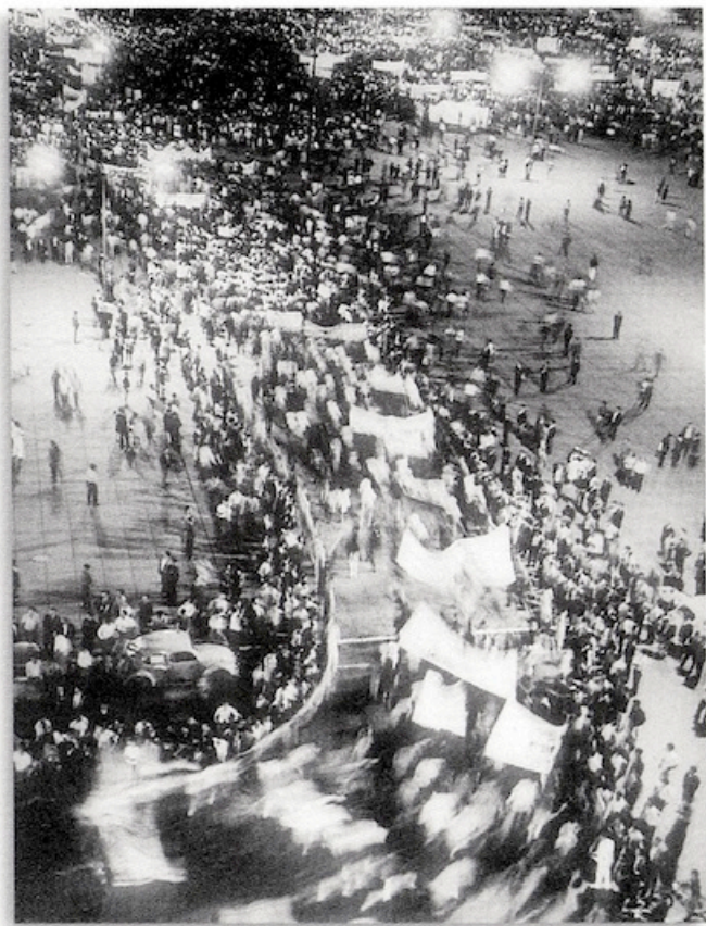
La marcha del silencio, 1968.