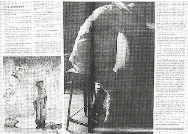
Reportaje gráfico "El drama de los cañeros", con texto de Froylán Manjarrez y foto de Héctor García (erróneamente acreditada a Rodrigo Moya). Sucesos para todos , núm. 1618, 5 de mayo de 1964, pp. 19-23. Acervo Hemeroteca Nacional de México, UNAM.

La fotografía, captada originalmente hacia 1960, se publicó en la revista Sucesos para todos , en 1964, como parte de un reportaje sobre las condiciones de trabajo de los cañeros. Froylán Manjarrez escribió: "El drama de los cañeros", texto que se publicó en tres entregas en números sucesivos de la revista. En la segunda de ellas, donde aparece la imagen de Niño del machete en dos formatos y páginas distintas, se menciona equivocadamente que las fotos pertenecen a Rodrigo Moya. 1 Sólo uno de los pies de foto acredita la imagen a Héctor García.