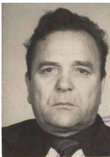
Ватутин Степан Иванович