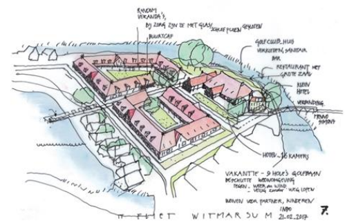
Knarrenhof bij zorgorganisatie.

RABO Bank Nederland is enthousiast over Knarrenhof. Samen wordt de financiering voor nieuwe projecten uitgewerkt!