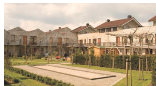
Voorbeeld van een twee-laags Knarrenhof.