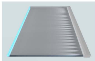
VIDRO COM BORDA JATEADA