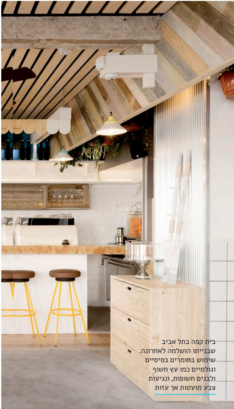
בית קפה בתל אביב שבנייתו הושלמה לאחרונה. שימוש בחומרים בסיסיים וגולמיים כמו עץ חשוף ולבנים חשופות, ונגיעות צבע מועטות אך עזות