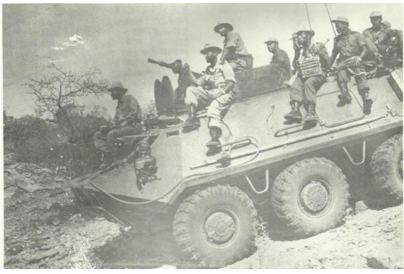
ጀግናው ጦራችን ከማረካቸው የጦር መሳሪያ አንዱ

<< ሜዳሊያውን ያገኘሁት በግል ጥረቴ ብቻ አይደለም ። የጀግኖች ወገኖች የተባበረ የትግልና የመሥዋዕትነት ዉጤት ነው ። ይህን ታላቅ ሜዳይ በመሸለሜ የላቀ ደስታ ይሰማኛል ። ይሁንና እድሜዬ ወጣት ስለሆነ ለዚች ዉድ እናት ሀገሬ ትናንት ከፈጸምኩት የበለጠ ለመፋለም ራሴን በይበልጥ አዘጋጃለሁ ።>> ይላሉ ጀግናው ሻምበል በቀለ በሬዳ