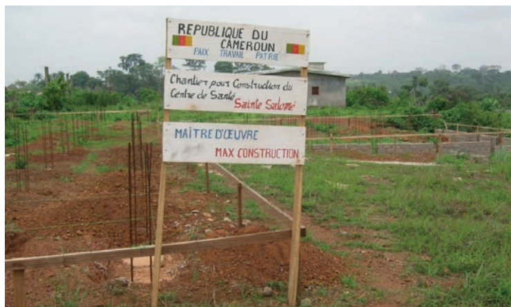
Das Grundstück für die neue Klinik

Für die Angestellten und die Übernachtung der Angehörigen von Patienten, sind separate Gebäude und eine Küche zur Zubereitung der Mahlzeiten vorgesehen.