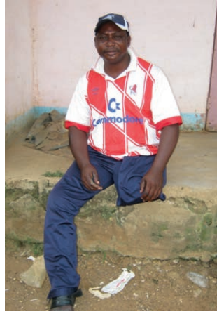
Diese Invaliden warten auf Behandlung und einen Rollstuhl