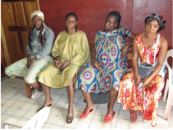
Diese Frauen warten auf den Schwangerschafts-Untersuchung