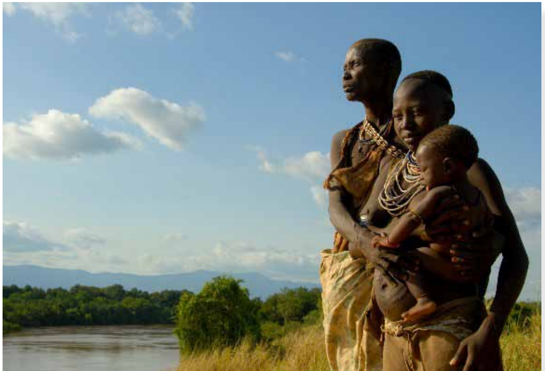
Agricultores indígenas en el Valle del Omo Inferior siembran a lo largo de las riberas fértiles cada año cuando las aguas de inundación del Río Omo retroceden. Una represa que ha sido propuesta podría eliminar los cultivos alimentarios de los campesinos cuando se elimine la inundación anual. También reducirá las tierras de pastoreo de las cuales dependen los pastores locales para alimentar sus ganados durante la temporada seca. Un menor flujo de entrada al Lago Turkana dañará la industria pesquera local y amenaza al único ecosistema por el cual el lago fue reconocido como Patrimonio de la Humanidad.

de la masiva entrega de tierras y derechos de agua. Las áreas donde se concentra el acaparamiento de tierras coinciden estrechamente con los sistemas de ríos y lagos más grandes del continente y, en la mayoría de estas áreas, el riego es un prerrequisito para la producción comercial. El gobierno etíope está construyendo una represa en el río Omo para generar electricidad y regar una gigantesca plantación de caña de azúcar; un proyecto que amenaza a los cientos de miles de personas nativas de la región que dependen del río, aguas abajo. También amenaza vaciar el lago de desierto más grande del mundo, el Lago Turkana, alimentado por el río Omo. En Mozambique el gobierno aprobó una plantación de 30 mil hectáreas a lo largo del río Limpopo, la cual habría afectado directamente a los campesinos y pastores que ahora dependen del agua. El proyecto fue cancelado porque los inversionistas no se presentaron, pero el gobierno está buscando a otros que se hagan cargo. En Kenya, una tremenda controversia ha surgido por los planes del gobierno de repartir inmensas áreas de tierra en el delta de Río Tana con desastrosas consecuencias para las comunidades locales que dependen del agua del delta. La ya degradada cuenca del río Senegal y su delta han sido objeto de entregas de cientos de miles de hectáreas de tierras, poniendo al