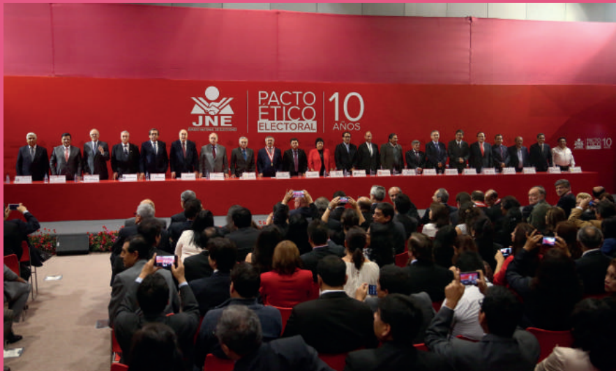
Pacto Ético Electoral - Jurado Nacional de Elecciones (2015)