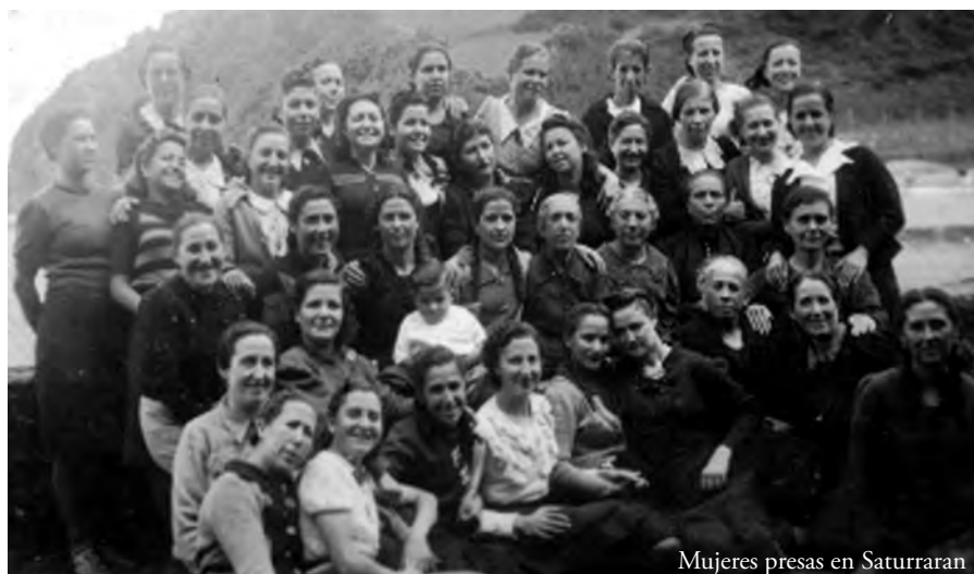
Mujeres presas en Saturrarán