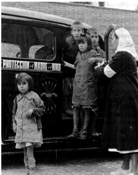
Autor: Hermes Pato. Tomada de la web de SBHAC www.sbhac.net .