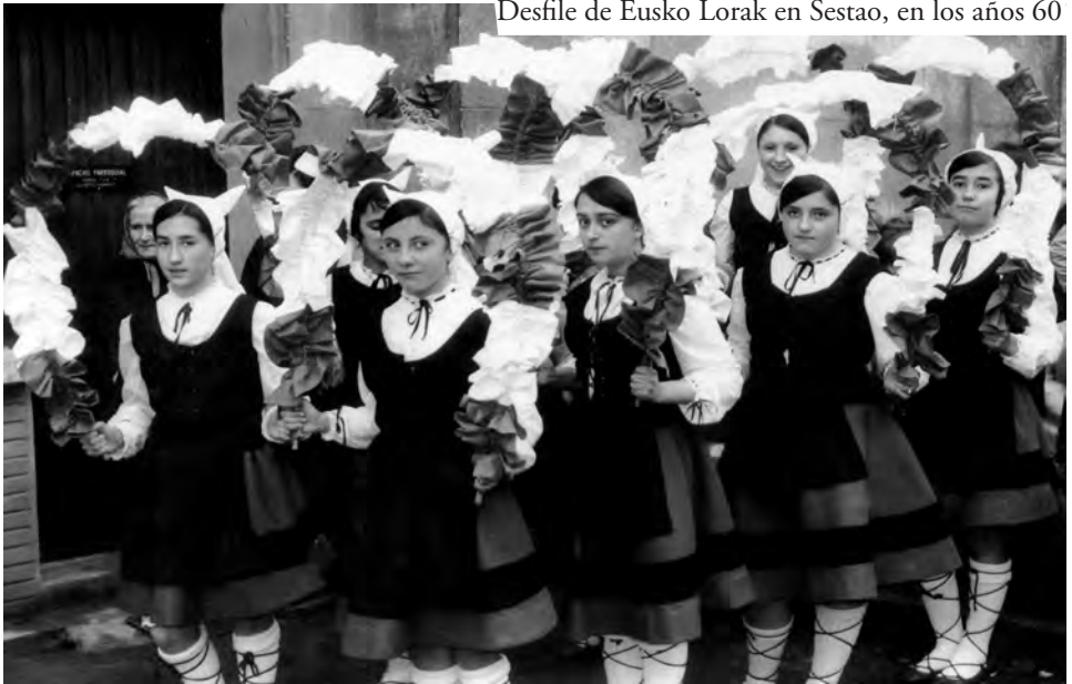
Desfile de Eusko Lorak en Sestao, en los años 60

Cualquier exteriorización del sentimiento nacionalista sería perseguida por el régimen franquista hasta el final de la dictadura, aunque a partir de los años 60 se produjo cierta tolerancia hacia los grupos que cultivaban el folklore tradicional.