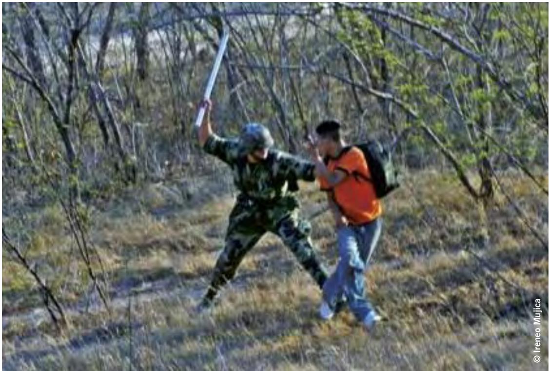
Miembro de la Marina mexicana durante una agresión contra migrantes cerca de Las Palmas, municipio de Niltepec, estado de Oaxaca, 31 de marzo de 2008.

Amnistía Internacional también recibió información sobre un caso de uso no autorizado de armas menos que letales que violó las normas internacionales.