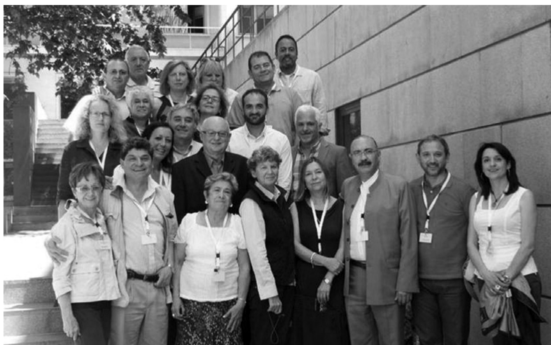
Participantes de la Reunión Mundial de Expertos en Educación Sexual, que se celebró el 20 al 21 de Junio 2011 en Madrid, España.