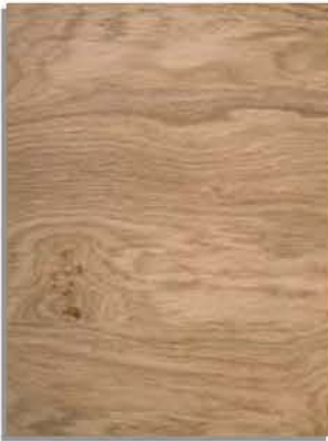
rovere nodi solmukuvioista tammipuuta