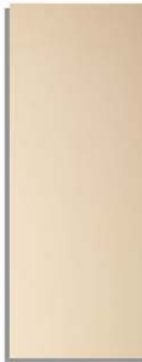
specchio bronzo (cat.1) pronssipeili