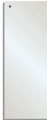
trasparente (cat.1) läpinäkyvä