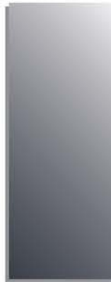
specchio fumo (cat.1) savulasi