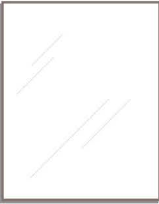
finitura brunito harjattuviimeistely