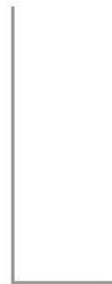
bianco (cat.2) valkoinen