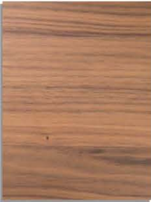
noce canaletto mustaa Amerikan pähkinä- puuta