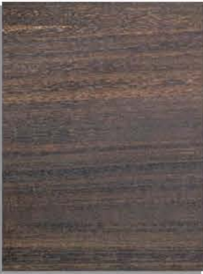
rovere termotrattato lämpökäsiteltyä tammipuuta