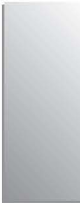
specchio (cat.1) peili