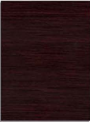
rovere moro tammipuuta mahonki- viimeistelynä