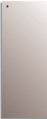
stopsol fumé (cat.1) savunharmaa stopsol