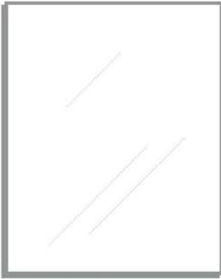
finitura alluminio alumiiniviimeistely