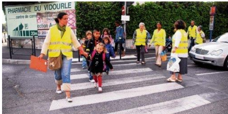
Figure 1 : exemple du Carapattes de l'école Henri de Bornier à Lunel (midi libre du 19 avril)

Lionel de l'équipe du TRI'porteur (06 88 21 44 58) - contact@tri-porteur.com