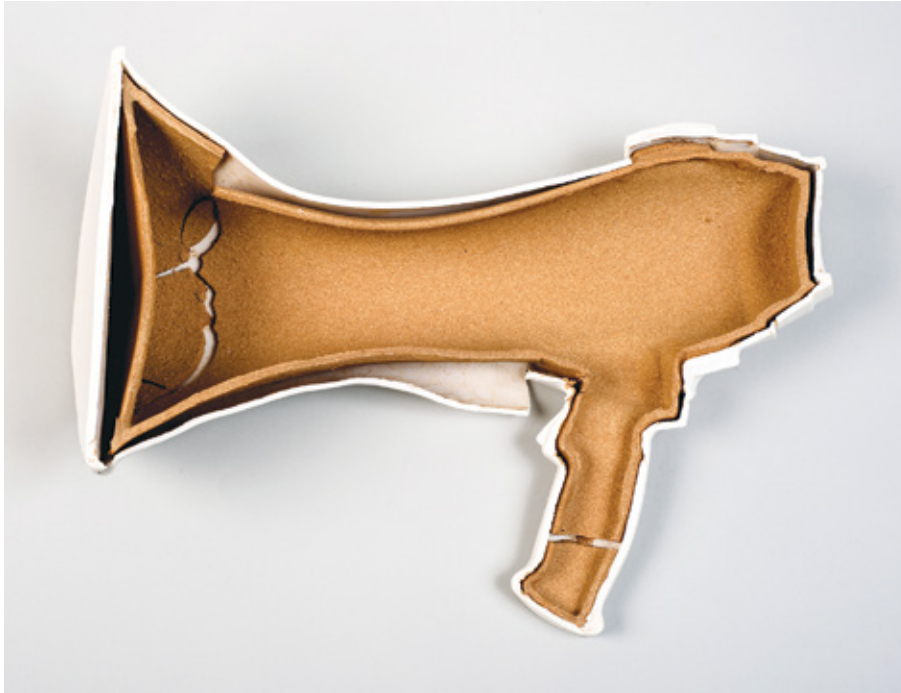
שלוסיית באוסן, ללא כותרת, 2013, חומר קרמי סקומי (S5) ופורצלן, יציקה, רוחב 35 ס"מ

לצורה ולחומר הבלעדיים, אל פעילות פרשנית המציבה בחזית מרחבים מושגיים המוטמעים בעומק הסימנים המוחשיים הממשיכים להתרחש ולקיים את הרגע. הוא חורג מתחום זמנו ונמשך אל היסטוריות אחרות המטות את ההווה על פי העבר כמו שההווה מטה את העבר בהתאם למצבו. השבירה, ההתפרצות והעיוות מעמיקים את היחסים בין כוחות הפועלים מעבר למופע הצורני של החפץ ופוגמים בנחוצות העולם כביטוי של תופעות חיצוניות המנותקות מתופעות אנוש פנימיות. המרחב הנפשי המכיל יראה, תשוקה והנאה נרשם כמציאות ומקבל צורניות המעצבת את היחסים בין האדם לסדר הדברים ואת השתקפות ההפנמה האישית של העולם החברתי. אמנות אינה מציגה את מה שקורה, אלא מסמנת מה עלול לקרות; היא אינה אחוזה באנקדוטה פרטית, אלא כרוכה בניסיון אוניברסלי להעיר את ההומני שבחברתי ■