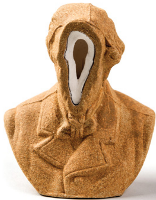
שלומית באומן, ללא כותרת, 2013, חומר קרמי מקומי (S5) ופורצלן, יציקה, גובה 8 ס"מ

משמעותו של חפץ נובעת מהוויה אוזלת ונרקמת שאינה מותירה אותו כבלעדי. הפגע האקולוגי מסמל מכניזם טבעי נרחב הנרקם בין כליה להתהוות וכורך מטענים של גורל אישי יחד עם תחושות של זמן ומרחב נזילים, שבריריים ומהתלים. מה שאזל מבטא רק את שורש הדברים של מצב אוזל שבו בני אדם וחפצים אינם ניצבים בודדים. הם משפיעים זה על זה ויוצרים סביבה שאינה דוממת. המרחב הפיזי הוא מרחב חברתי, שהוא מרחב נפשי, שהוא מרחב של דמיונות ושיאיות. מגמת ההתפתחות של התרבות, מסביר פרויד, היא חיבור של בני האדם בקשר גומלין נפשי, והכורח החברתי של עבודה משותפת אינו מספיק על מנת להגשים