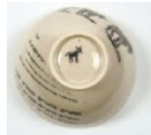
למעלה ובכיוון השעון: כלים בעיצוב אנה כרמי, איתן גרוס, רועי מעיין, סטודיו אנדר, סטודיו חרסה