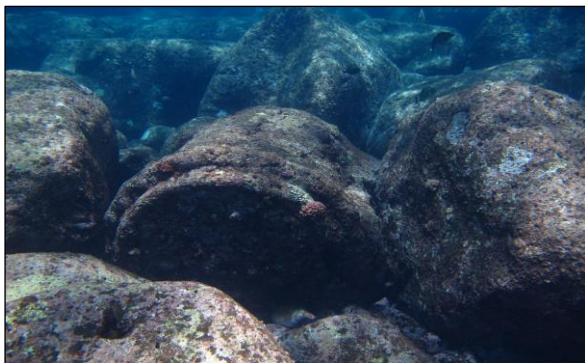
Élément moteur.