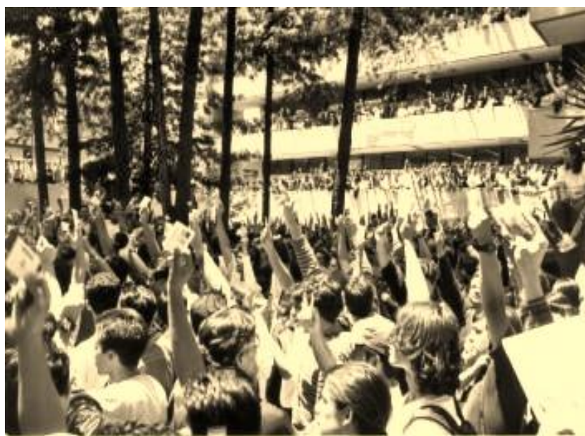
Foto 2. En la Facultad de Ingeniería, miles de estudiantes votan por el estallido de la huelga.

En similitud con otras facultades, en Políticas se habían desarrollado dos instancias para poner en marcha el movimiento estudiantil: la organización de un CGR, que era algo por lo que tenía afinidad el CEU, y por otra parte el mecanismo de asambleas directas. En los hechos éstas últimas hubieron de ser las que contaron con mayor legitimidad y las que terminaron definiendo la huelga. A unos cuantos días de que llegara el 20 de abril, casi mil estudiantes por cada uno de los turnos votaron abrumadoramente a favor del estallido. Sin embargo las diferencias generadas desde este momento dieron lugar a dos polos antagónicos: uno muy radicalizado y el otro renuente a aceptar los acuerdos de las asambleas.