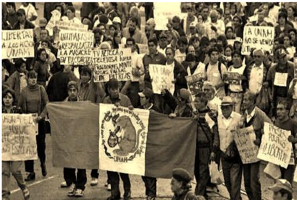
Foto 14. 9 de febrero de 2000: En una marcha que va del Ángel de la Independencia al Zócalo, más de cien mil personas repudian el asalto policiaco militar a la UNAM y exigen la liberación de los estudiantes presos.

Al regresar a sus escuelas, los estudiantes encontraron desarticulados diversos espacios de organización histórica, dentro de los cuales, el más emblemático había sido el auditorio Che Guevara de Filosofía y Letras: que hubo de ser bloqueado, su mural exterior borrado, y su nombre reemplazado por el del pensador positivista Justo Sierra . En la Facultad de Economía, el histórico cubículo 104, fue completamente desmembrado y dividido por un muro de concreto; en Ciencias, los locales del Comité de Huelga fueron completamente demolidos; en el bachillerato y las escuelas periféricas, los espacios de organización fueron adecuados como bodegas o salones de clase, etcétera. Pensando que el CGH no levantaría más la cabeza, la burocracia se había dedicado durante los nueve días de ocupación policiaca, a remodelar las instalaciones y a desaparecer todo vestigio de la huelga, pero lejos de atemorizarse, la reacción de los ex huelguistas fue aún más embravecida.