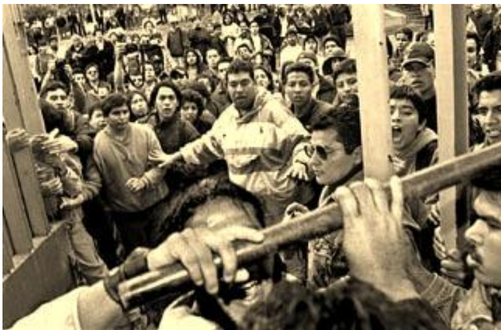
Foto 9. 27 de octubre de 1999: Integrantes del CGH recuperan la ENEP Acatlán luego de que funcionarios de la Universidad, miembros del CEU histórico y antiparistas, irrumpieran en el plantel e intentaran entregar las instalaciones a la policía.