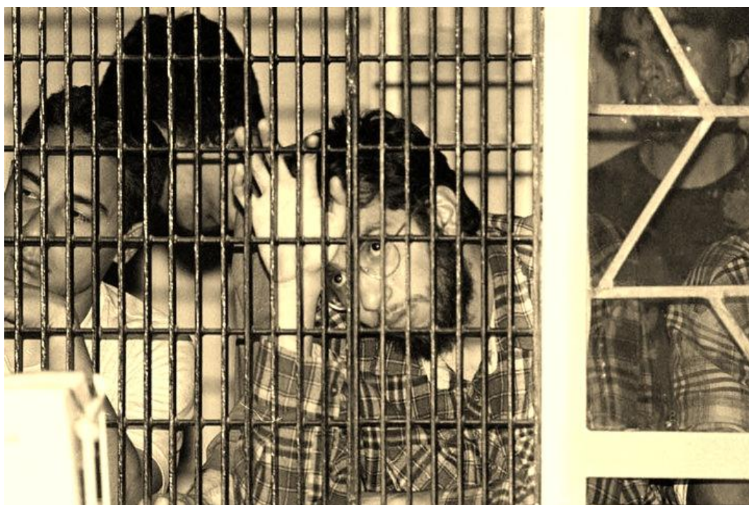
Foto 15. Estudiantes detenidos durante los acontecimientos de la preparatoria 3, rinden declaración ante los juzgados federales ubicados en el Reclusorio Norte. En total fueron encarcelados 998 huelguistas, la mayoría de ellos, procesados por los delitos de despojo, robo calificado, lesiones, motín y terrorismo.