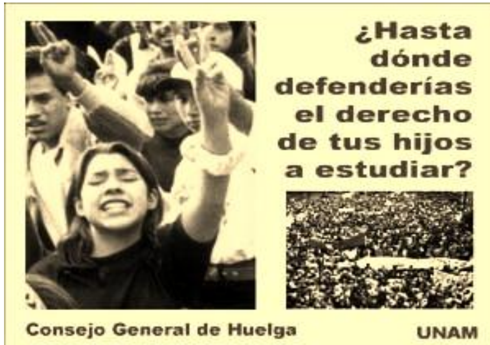
Foto 8. Uno de los carteles más emblemáticos del CGH. Por cada mes de huelga, la Comisión de Prensa y Propaganda emitió un millón de volantes y alrededor de 250 mil carteles.

La propuesta de los ocho profesores eméritos no resolvía las demandas del movimiento estudiantil, por el contrario, se trataba de un exhorto para que los estudiantes desistieran de los puntos centrales de sus peticiones en aras del “restablecimiento de la vida académica y el desarrollo de las funciones sustantivas de la universidad”, un llamado no muy distinto al que los empresarios y el Estado suelen hacer a los trabajadores de las industrias estratégicas cuando van a la huelga: “en aras del bien común”, “en pos del desarrollo nacional”.