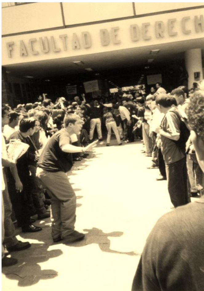
Foto 3. 21 de abril de 1999: Concentración de huelguistas a las afueras de la Facultad de Derecho. Por más de 48 horas estudiantes a favor de la huelga y autoridades universitarias, mantuvieron una tensa disputa por el control de las instalaciones.

país. En la memoria de la izquierda mexicana pesaban aún las sangrientas secuelas de la lucha contra el fraude electoral de 1988 y la derrota que en 1995 había sufrido el Sindicato Único de Trabajadores de Ruta 100 (SUTAUR-100) cuando todo su Comité Ejecutivo había sido encarcelado. Pero hubo de