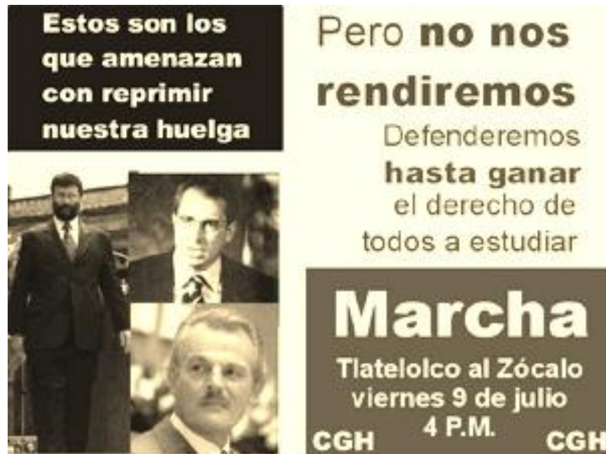
Foto 7. A principios de julio de 1999 el gobierno federal alistó los preparativos técnicos y políticos para romper la huelga mediante el uso de la fuerza pública. La desenfrenada campaña de propaganda desarrollada durante estos días por miles de jóvenes en las calles, frustraron el objetivo estatal.

Además, cuando las bases del movimiento rechazaron de forma aplastante la propuesta de “cuotas voluntarias” del 7 de junio y quedó evidenciado el papel de esquirolaje que desde abril habían sostenido sus dirigentes, la estructura de esta coalición entró en crisis y en sus filas aparecieron fisuras. El mismo Fernando Belaunzarán en su Balance a 10 años atestigua: “... diferentes tribus perredistas vieron la ocasión para desplazar a quienes consideraban sus adversarios internos y tenían su principal fuerza en la UNAM, así que se les hizo fácil hacer causa común con “la ultra” para lograrlo sin caer en cuenta que después ya no podrían tomar la conducción del movimiento y darle un rumbo diferente...”. 243 De haber preservado su estructura organizativa en la UNAM, el CEU histórico habría podido disputar desde el inicio la dirección del movimiento estudiantil, pero tan tarde hubo de articular sus células, que los acontecimientos lo colocaron en una posición de franca desventaja.