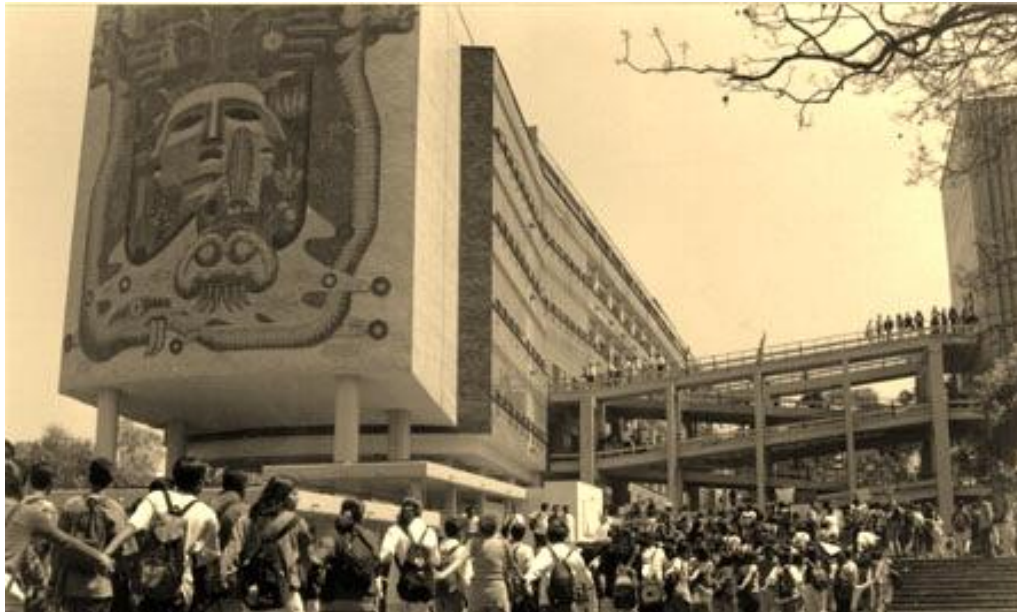
Foto 5. Toma de la Facultad de Medicina. Con la Universidad en huelga, el CGH se convirtió en un órgano de dirección muy fuerte, masivo, con influencia entre decenas de miles de estudiantes, y cuyas resoluciones comenzaron a tener gran resonancia a escala nacional.

movimiento mucho más cohesionado y con mucho mayor unidad que lo que demostró el CGH”. 211