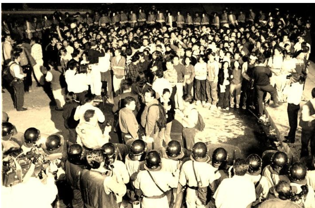
Foto 13. 1 de febrero de 2000: Martes negro de la prepa 3. La policía militar cerca a cientos de huelguistas, mientras a las afueras decenas de padres de familia y vecinos protestan por la intervención.

El plantel quedó custodiado por la PFP y los 245 estudiantes detenidos fueron conducidos a la PGR de “Camarones”, donde se les impidió el contacto con abogados de su confianza, y se les impuso defensores de oficio que se negaron a ofrecer cualquier probanza en su beneficio. Al finalizar el proceso, se les imputaron los delitos de terrorismo, motín, sabotaje, robo específico, daño en propiedad ajena, asociación delictuosa, lesiones y despojo, entre otras. Una vez declarado su auto de formal prisión, la mayoría fue turnada al Reclusorio Norte, mientras que los menores de edad fueron remitidos a las oficinas del Tutelar para Menores. Entre los universitarios trasladados al Reclusorio Norte estaba también Leticia Contreras ( La Jagger ) a quien la Rectoría acusó de haber orquestado la violencia.