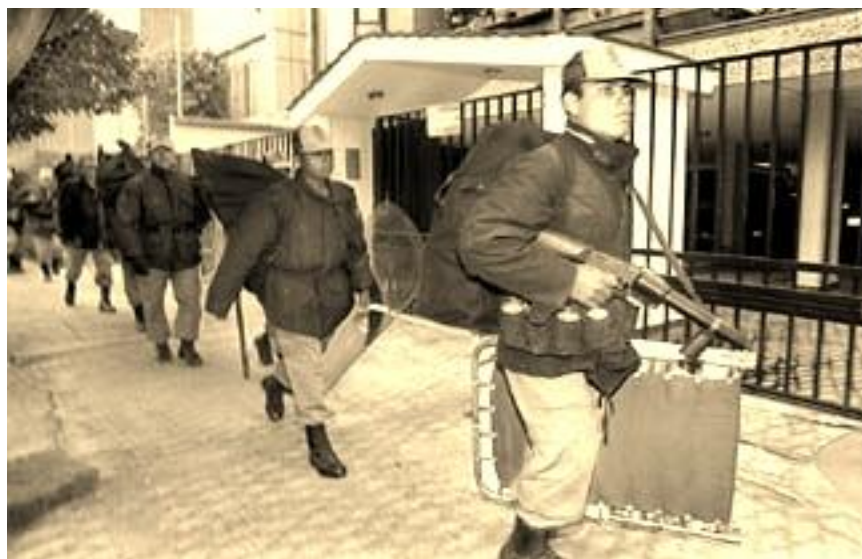
Foto 12. Elementos armados de la PFP toman control del CUEC el 26 de enero de 2000, luego de que estudiantes adheridos a la CDE levantaran la huelga.