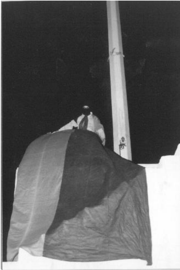
Foto 4. 20 de abril de 1999: Un joven iza una bandera rojinegra en la explanada de la Rectoría, mientras en el auditorio Che Guevara miles de estudiantes constituyen el Consejo General de Huelga.

en la “Preparatoria Pascual Ortiz” de la UMSNH; etcétera. 205