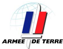
7eme Bataillon de Chasseurs