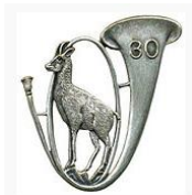
30eme Bataillon de Chasseurs