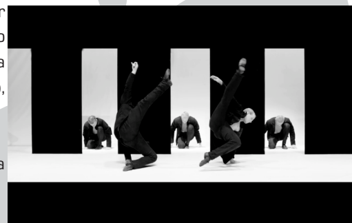
I Said YOU! - Lubica Sopkova

EUA, 2013, 5'30", Dir. e Cor.: Marta Renzi