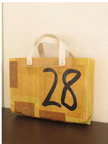
つながりのかばん28