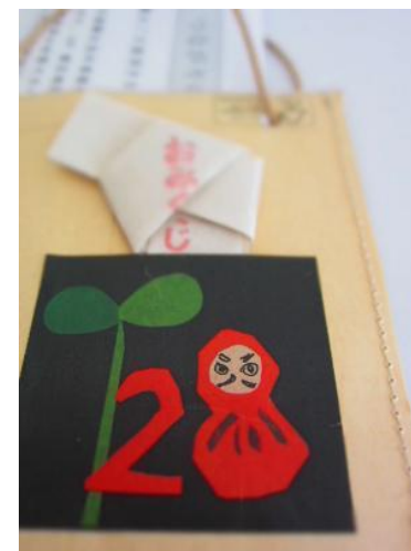
付録 だるまちびバック (おみくじ付)