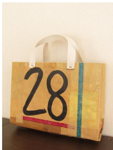
つながりのかばん28 (mt) マスキングの色はおかせ下さい